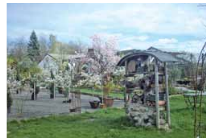
Auf dem großen Areal der Gärtnerei finden auch immer wieder Ausstellungen sowie Kunst- und Musikveranstaltungen, wie z.B. „Kunst im Gewächshaus“ statt. Auf der Internetseite findet man die Termine.

ist reichhaltig und umfasst Stauden, Blütensträucher, Hausbäume, Heckenpflanzen, Bodendecker, Solitärgehölze und Obstgehölze. Da findet eigentlich jeder das Passende für seinen Garten, egal wie groß oder klein dieser ist. Dazu gibt es natürlich fachlich kompetente Beratung in allen Pflanzenfragen. Aber die Gärtnerei Berg bietet ihren Kunden auch Gartenplanung oder Gartenpflege vor Ort an. Auch das Anlegen und Pflegen von Gräbern sowie die Bepflanzung von Blumenkästen und die Anlieferung von Pflanzen gehören mit zum Service. Ein weiterer Bereich ist die Floristikabteilung, die für verschiedenste Anlässe wie Hochzeiten, Kommuni-