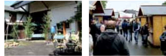
Offene Höfe und Markttag erfreuen alle Gäste und Besucher.