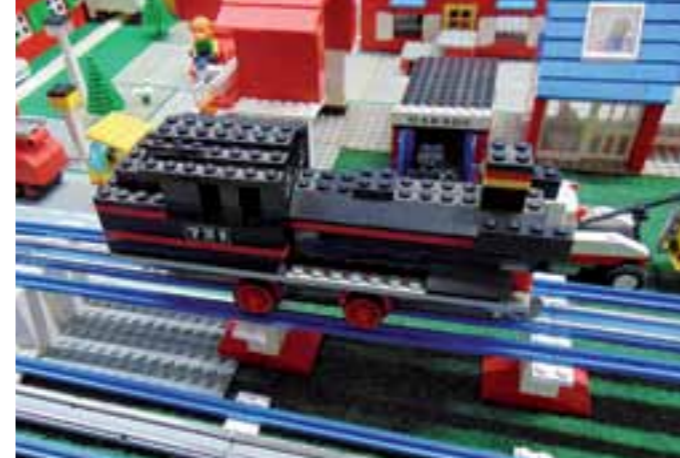
Modell 721 von 1969

Oliver: Meistens auf Flohmärkten. Wir gehen meistens zweimal im