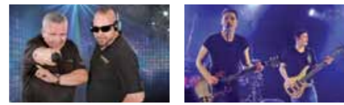
Für die abendliche Stimmung im Festzelt sorgen am Donnerstag die Hunsrück DJs (li.) und am Samstag die Shakers (re.).