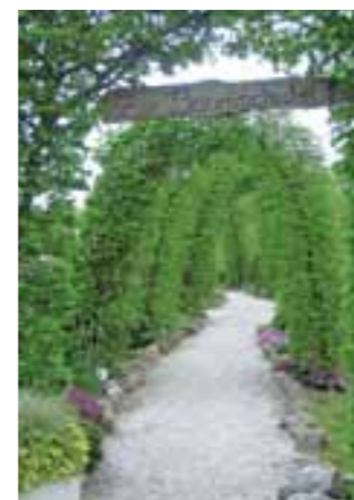
Das vielfältige Sortiment umfasst saisonale Beet- und Balkonbepflanzung, Stauden sowie Gehölze.

Im Sommer bietet Berg sogar selbst angebautes Gemüse an. Alles frisch und ganz regional. Die Pflanzen werden noch konventionell produziert, durch den Einsatz von Nützlingen und Pflanzenschutzmitteln wird aber auf chemischen Pflanzenschutz fast vollständig verzichtet. Zum Unternehmen gehört auch eine Baumschule, in der Kunden die Sträucher und Bäume finden, die sich für den Anbau in unserer Region bewährt haben. Das Sortiment