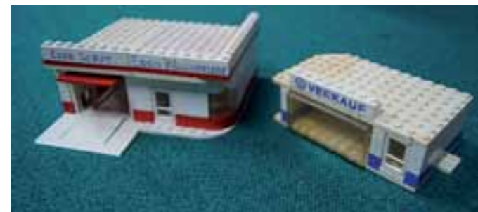
Diese beiden Werkstätten sind über 60 Jahre alt.

Monat. Die Internetpreise sind oft zu teuer, für ein Kilo bunt gemischte Legosteine bezahlst du dort 30 Euro.